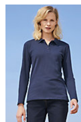
SOL'S PERFECT LSL WOMEN 02083